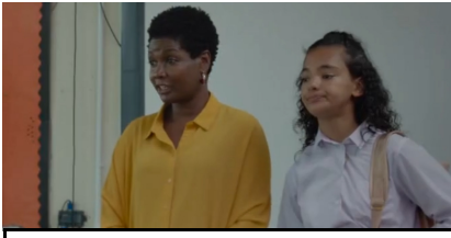
plan rapproché taille