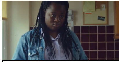
plan rapproché poitrine