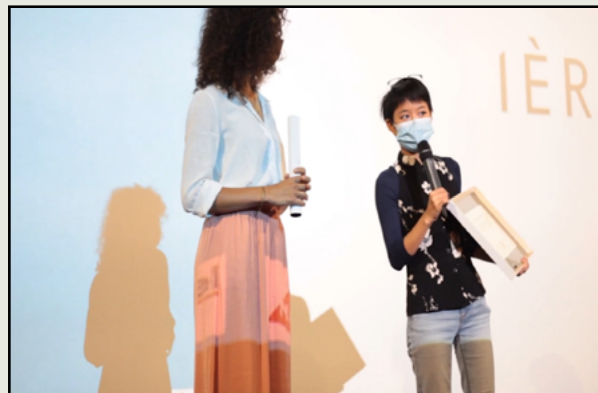
Photo de la cérémonie de remise des prix de la 1ère édition du festival en 2021