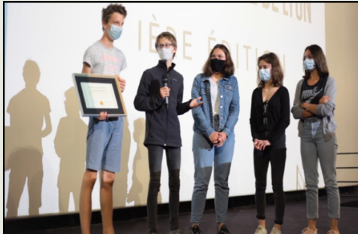
Cérémonie de remise des prix de l'édition 2021 du festival