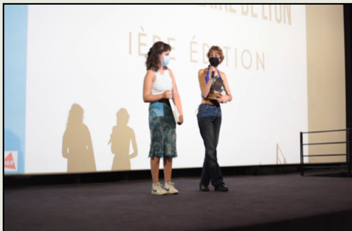
Photo de la cérémonie de remise des prix de la 1ère édition du festival en 2021