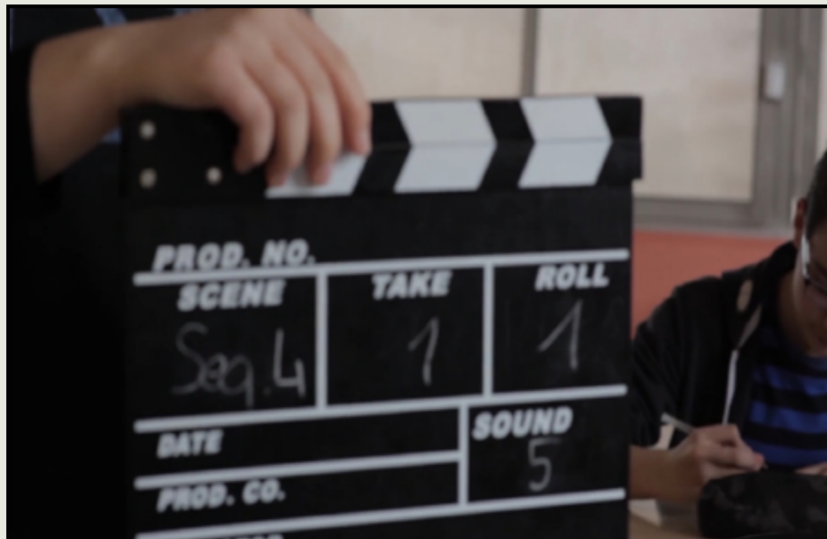
Photo de tournage lors de la réalisation d'un film pour la 1ère édition du festival en 2021