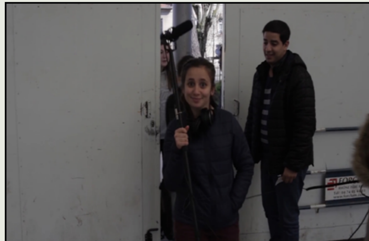
Photo de tournage lors de la réalisation d'un film pour la 1ère édition du festival en 2021