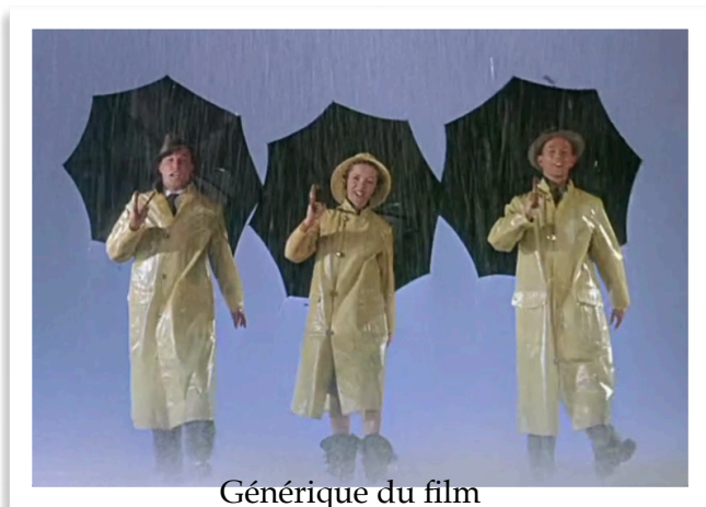
Générique du film