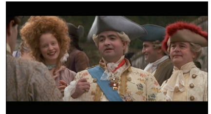
Le Roi et la Reine