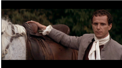
Ponceludon de Malavoy

Attribue un titre à chacun des personnages que tu as vu pendant la projection. Ces titres doivent permettre de les définir.