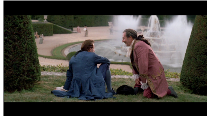
Marquis de Bellegarde