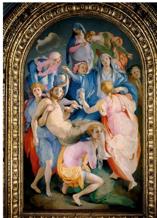
PONTORMO, La Déposition , 1526. REMBLEZ, MALFRATS, VOICI