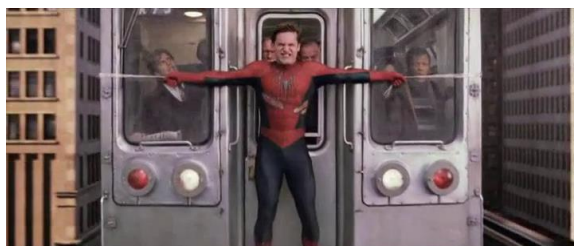
Photogramme Spiderman 2 - A