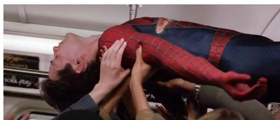
Photogramme Spiderman 2 - B