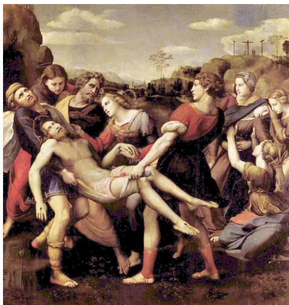
RAPHAËL, Déposition Borghese (panneau central du Retable Baglioni ), 1507.

Bible, « Evangile selon Matthieu », 27, traduction œcuménique de la Bible, La Pochothèque, 1996.