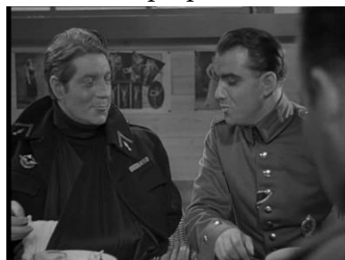
Photogramme a du plan 3