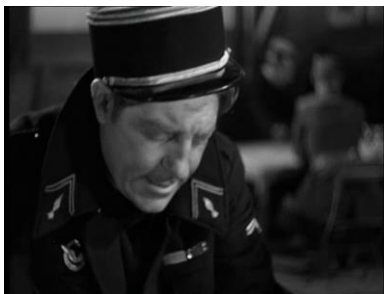
Maréchal (Jean Gabin)