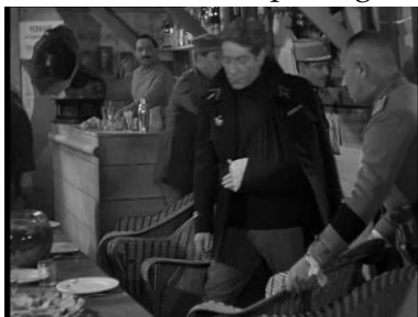
Photogramme du plan 1