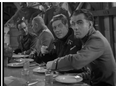
Photogramme b du plan 3