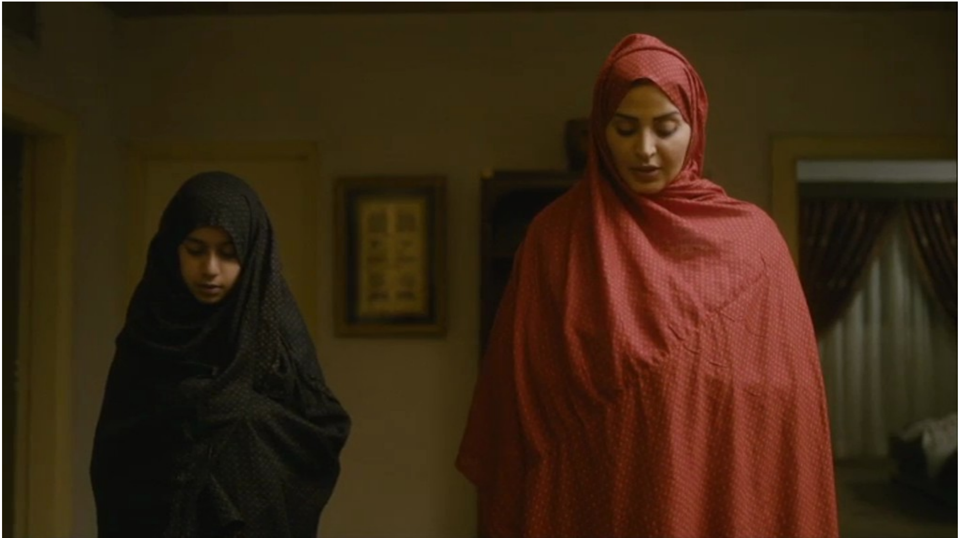
Collèges au cinéma 2015 - NR -