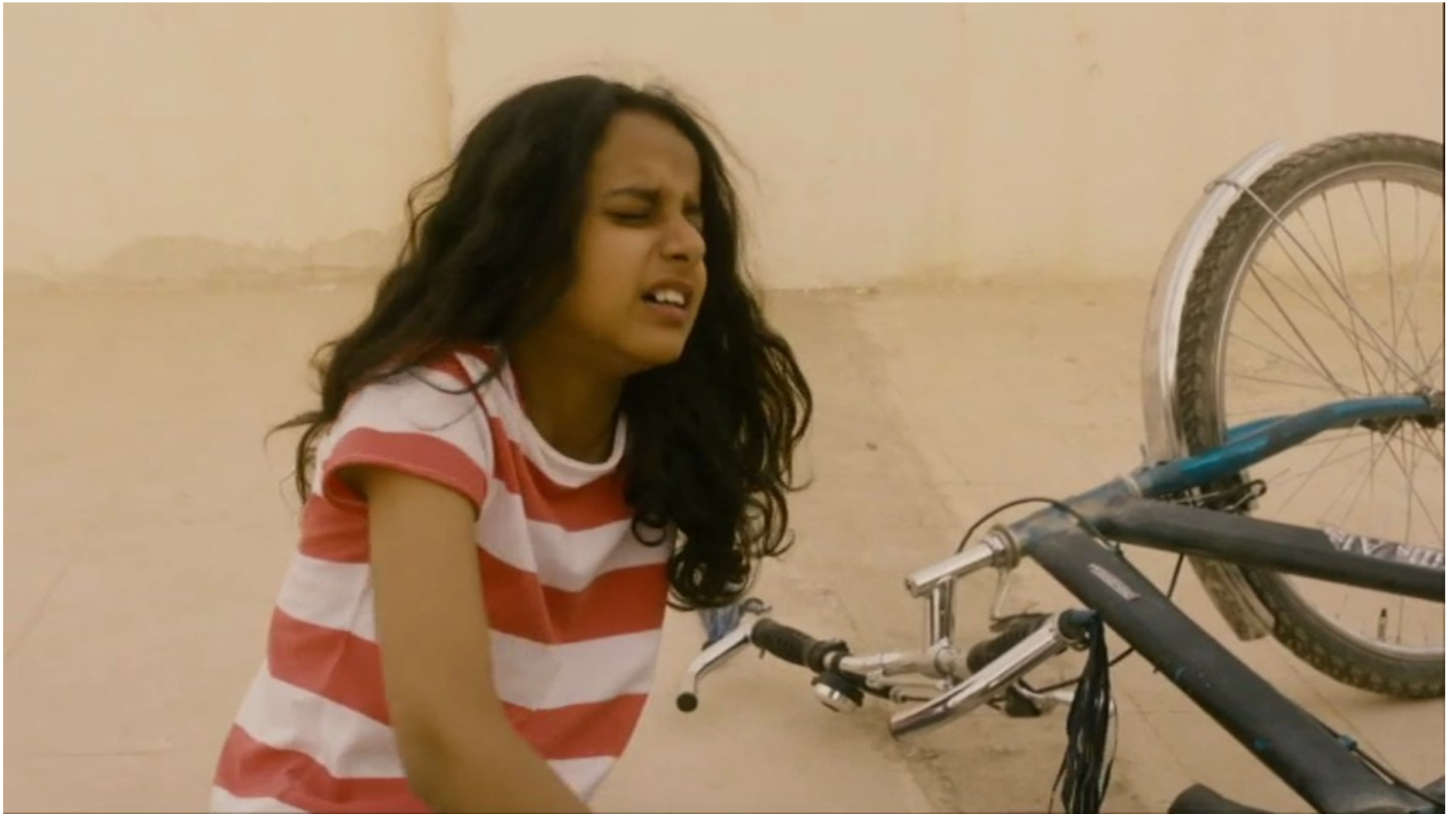
Collèges au cinéma 2015 - NR -