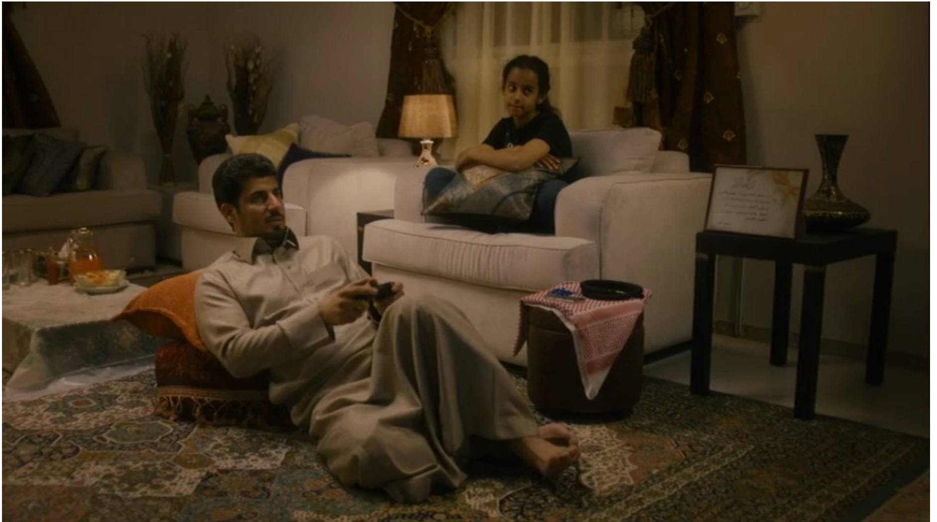
Collèges au cinéma 2015 - NR -