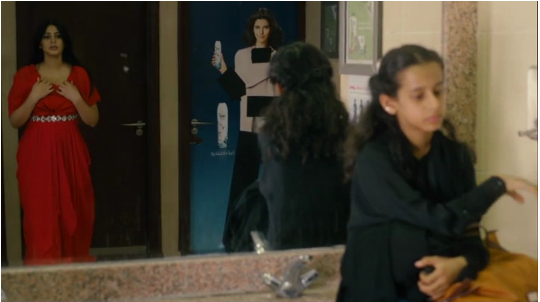
Collèges au cinéma 2015 - NR -