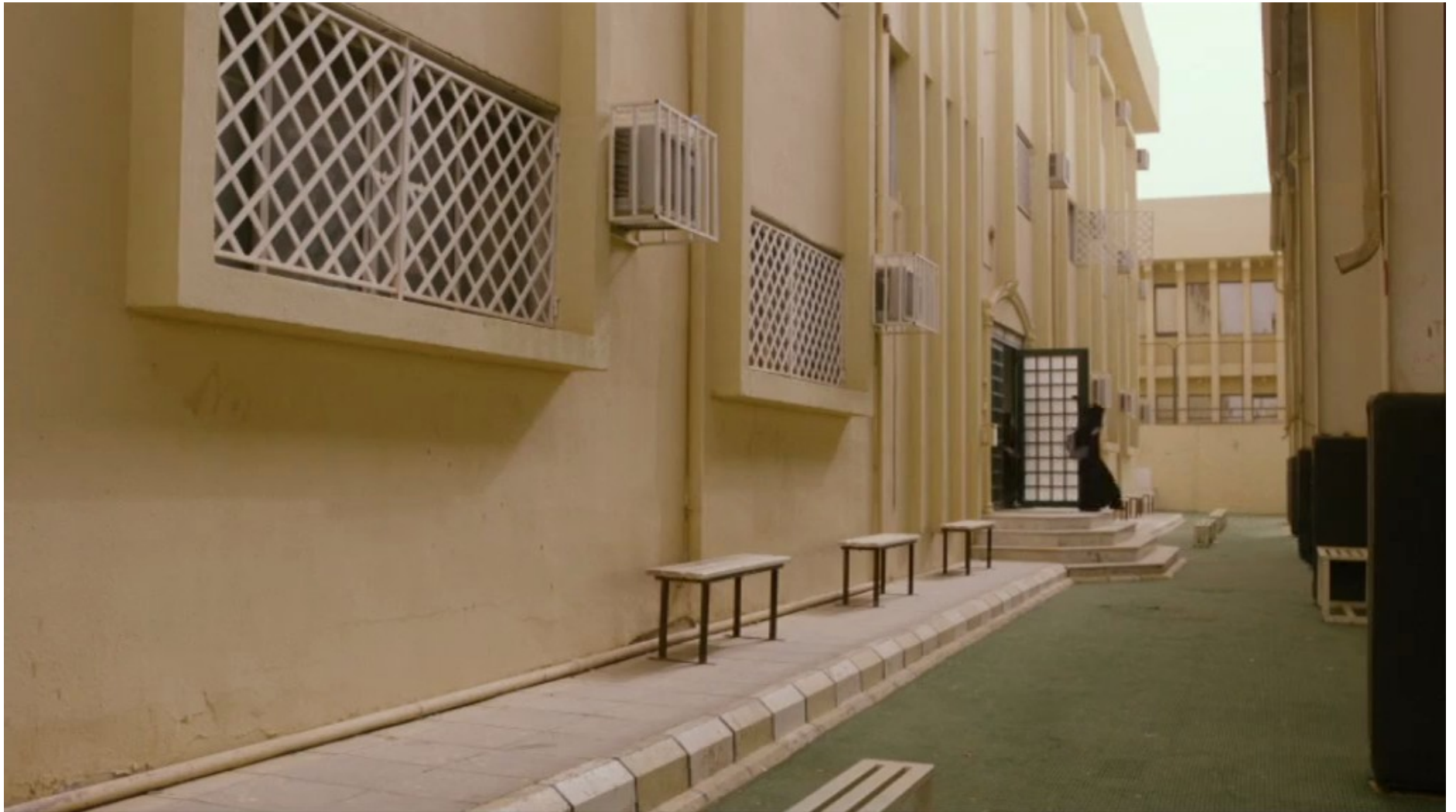
Collèges au cinéma 2015 - NR -