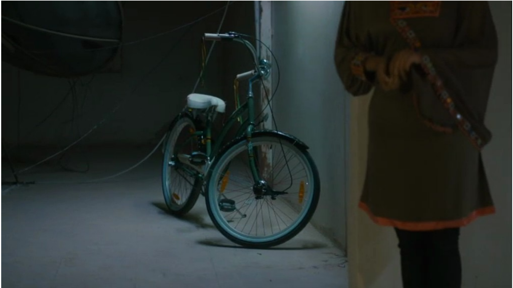
Collèges au cinéma 2015 - NR -