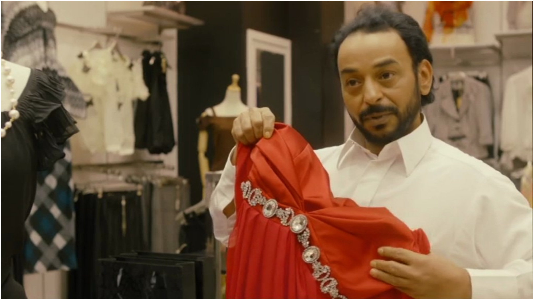
Collèges au cinéma 2015 - NR -