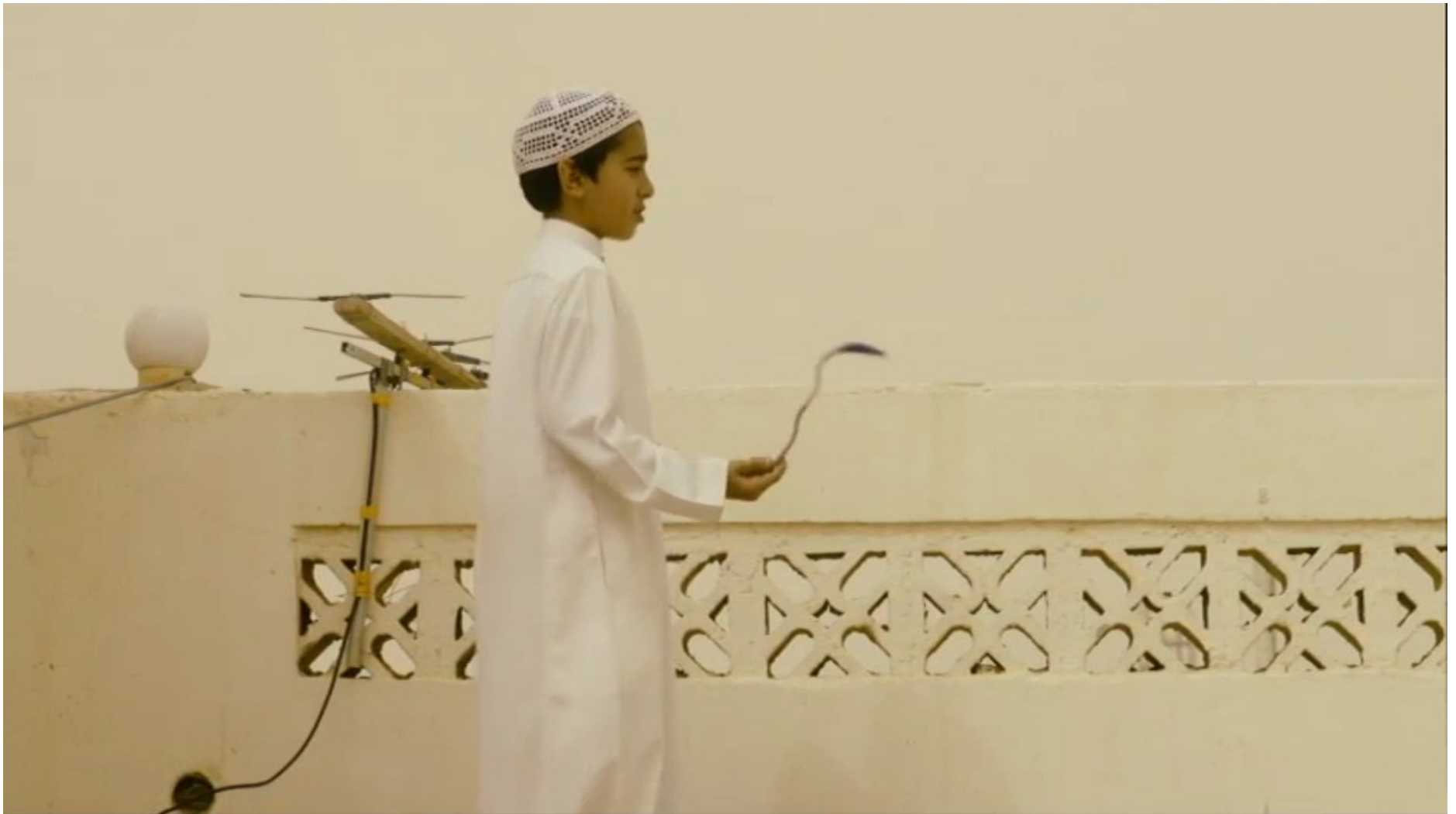
Collèges au cinéma 2015 - NR -