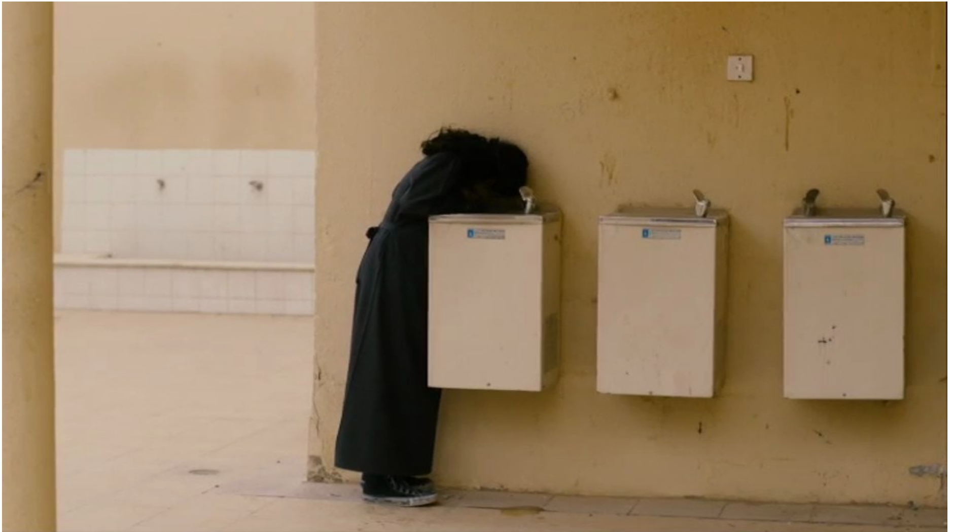
Collèges au cinéma 2015 - NR -