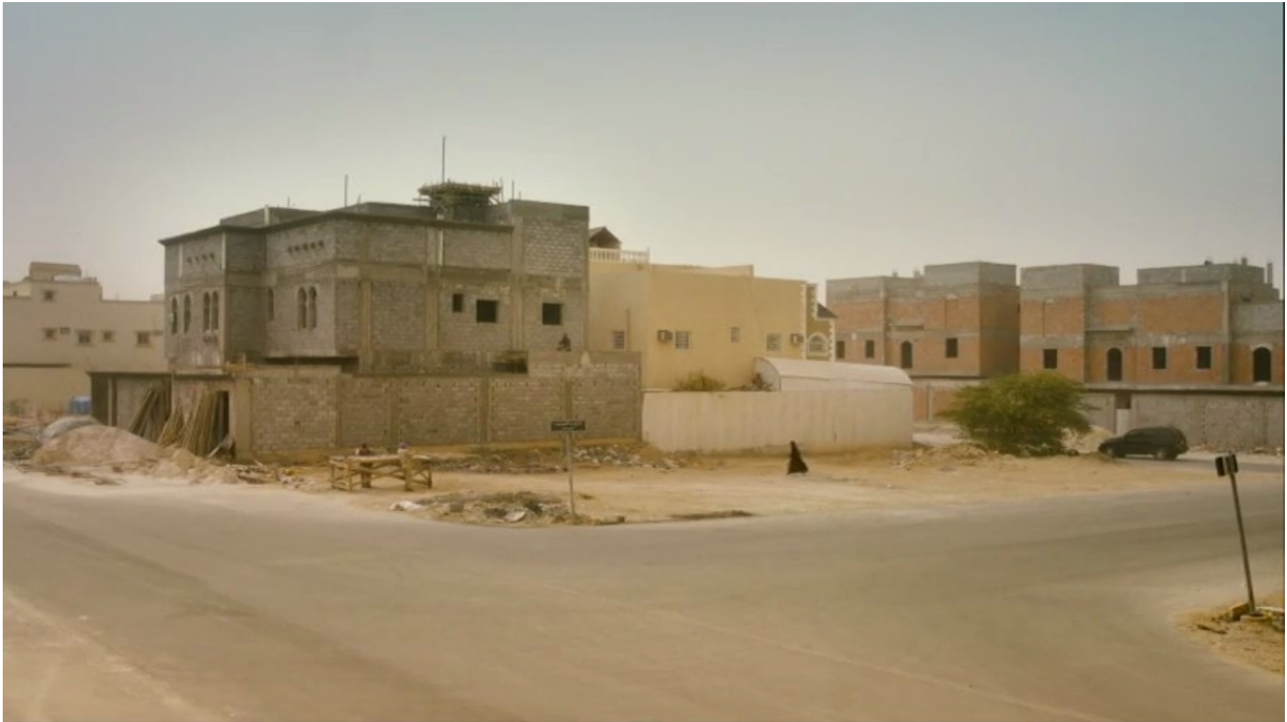
Collèges au cinéma 2015 - NR -