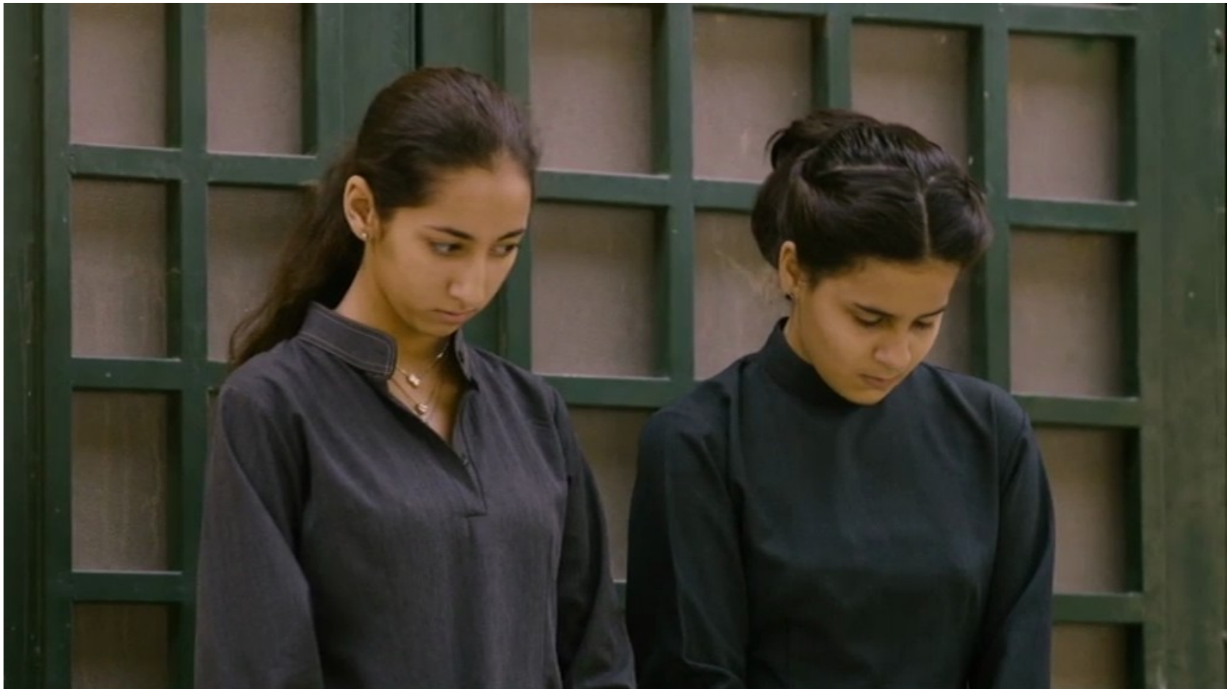
Collèges au cinéma 2015 - NR -