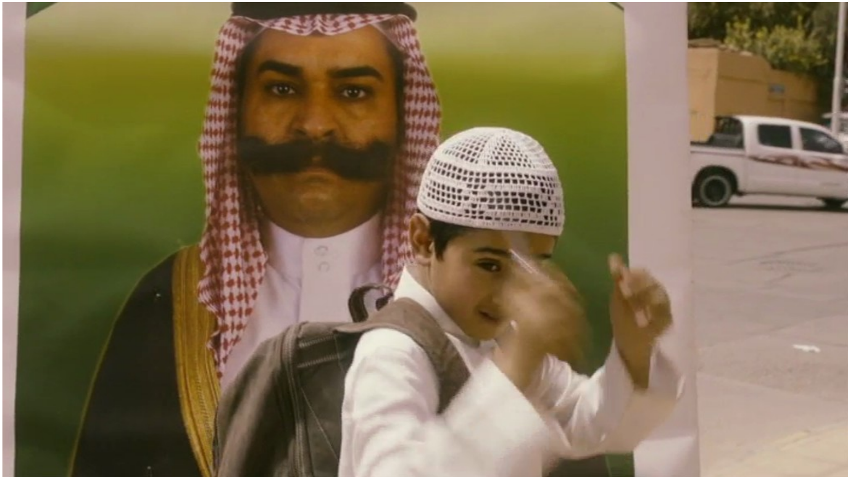
Collèges au cinéma 2015 - NR -