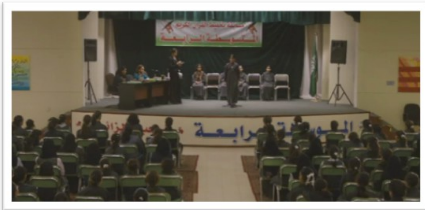
Collèges au cinéma 2015 - NR -