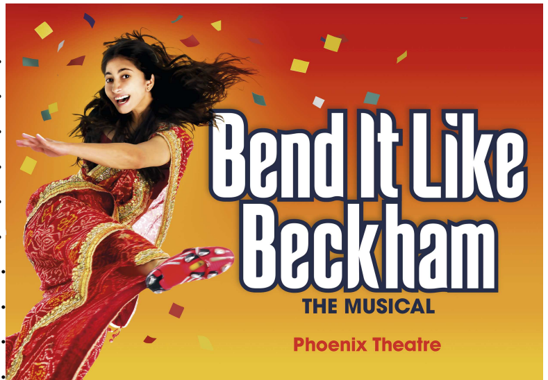
Affiche britannique pour la comédie musicale